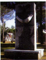
Werk von Raymond Lohr

We.: "Rümelinger Denkwürdigkeiten" (1973), "Das Vermächtnis einer Jugend" (1982), "Kayltaler Memorabilien" (1985), "Dët an dat aus der Lëtzebuurger Biergbau-geschicht" (1997).